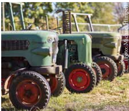
Zum Treckertreff wird es laut im Museum.

Mähbinder zu Leibe gerückt. Kinder können dabei helfen, die wertvollen Feldfrüchte einzusammeln, und erfahren dabei, wie wichtig und schwer die Arbeit Gleichaltriger auf den Feldern früher war. Motorisierte Erntemaschinen machen an anderer Stelle im Museum deutlich, wie drastisch sich Ernteprozesse im Laufe des 20. Jahrhunderts verändert haben.