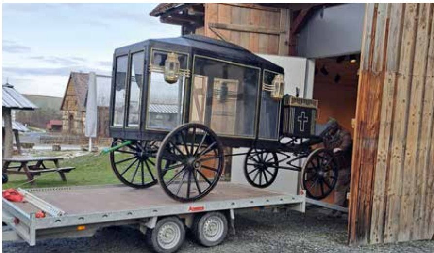
Anlieferung Totenkutsche in der Stallscheune aus Asterode

nen uns die Themen im Alltag? Knapp 100 Exponate aus der Zeit vom Ende des 18. Jahrhunderts bis heute – vom Hebammenlehrbuch aus dem Jahr 1785 bis zum Muttermilch-Schmuck aus dem Jahr 2025 – bringen den Besuchenden diese Fragestellungen und Themengebiete näher.