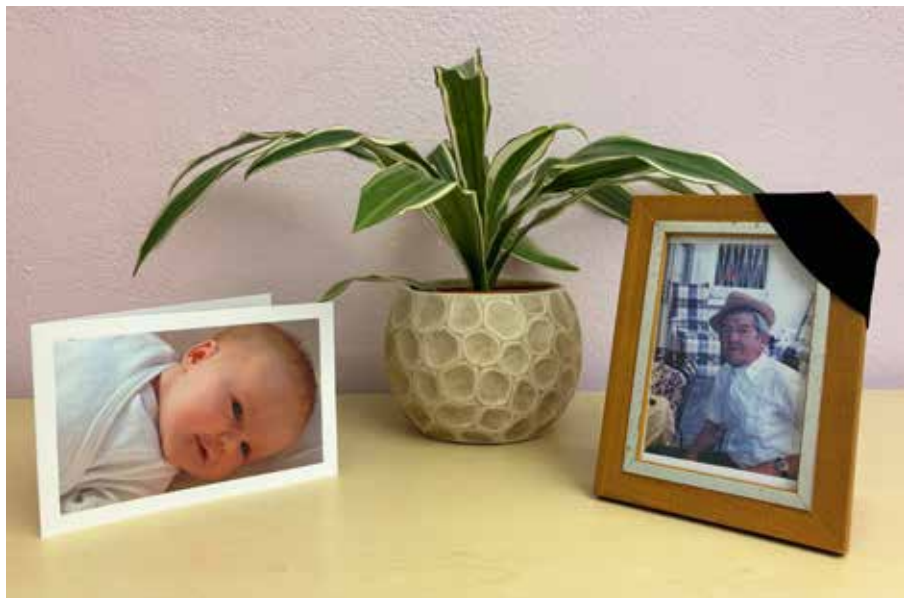
Die Ausstellung lädt zum Nachdenken ein: Über Bekanntes und Unvertrautes, über Erinnerungen und neue Perspektiven.

Einem besonderen Thema der Alltagskultur nimmt sich in diesem Jahr die Sonderausstellung in der Stallscheune aus Asterode an, dabei stehen Beginn und Abschied vom Leben im Mittelpunkt. Ein zentrales Motiv sind dabei Herzschläge, sie begleiten uns unser Leben lang. Schon im Mutterleib sind die ersten Töne zu hören. Die letzten Herzschläge hingegen markieren das Ende des Lebens. Veränderungen und Gleichbleibendes rund um Menschen, Orte und Erinnerungen werden in diesem Zusammenhang betrachtet. Thematisiert werden dabei Fragen wie: Wer begleitet die ersten und wer nach den letzten Herzschlägen? Wie erinnern wir uns an Geburt und Tod von geliebten Menschen? Und wie begeg-