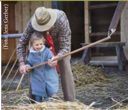
Ein Highlight für Groß und Klein zum Ende des Sommers: das Erntefest.

Mähbinder zu Leibe gerückt. Kinder können dabei helfen, die wertvollen Feldfrüchte einzusammeln, und erfahren dabei, wie wichtig und schwer die Arbeit Gleichaltriger auf den Feldern früher war. Motorisierte Erntemaschinen machen an anderer Stelle im Museum deutlich, wie drastisch sich Ernteprozesse im Laufe des 20. Jahrhunderts verändert haben.