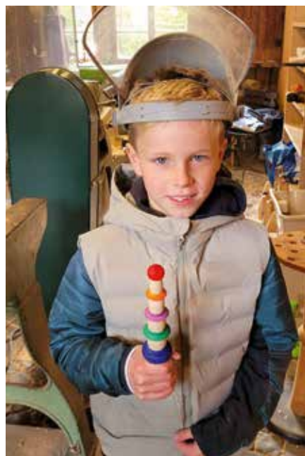
Voller Stolz wird das selbstgedrechselte Holzstück präsentiert.

konnten scheinbar mit dem Holz-Handwerk viel anfangen. Besonders die Kleinen drängten zum Weitergehen.« Das sollte sich ändern. Versuchsweise durften einzelne Kinder unter Aufsicht der Fachleute mitmachen und kleine Holzkunststücke fertigen. Die Mitglieder der Drechslergruppe fanden es erstaunlich, wie wenige Kinder im Alter von 10 bis 12 Jahren Erfahrung mit einfachem Holz gemacht hatten. Holzer: »Manche Eltern schützen ihre Kinder wie in einem Kokon. Die Kinder blühen auf, wenn sie den mal verlassen